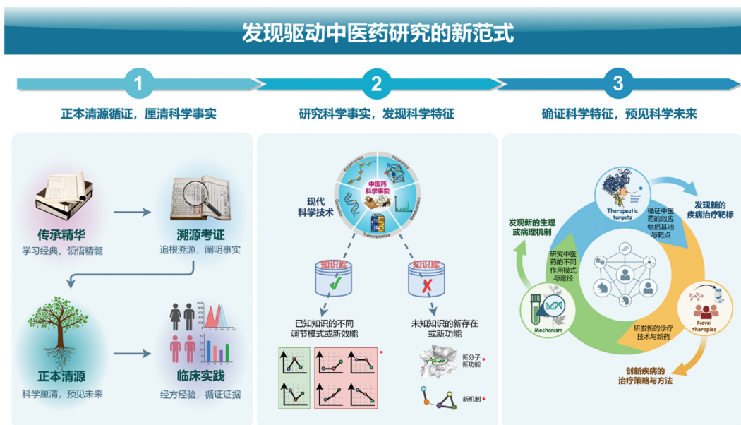
图 2 发现驱动中医药研究的新范式示意图

与确认中医药临床疗效的验证性研究范式不同,今后应当更加重视发现驱动中医药研究的新范式,以中国医学科学哲学和理论思想为指引,发现中医药防治疾病和维持生命健康的精华与特征,尤其与现代医学的科学差异,发现新的生理现象、新的病